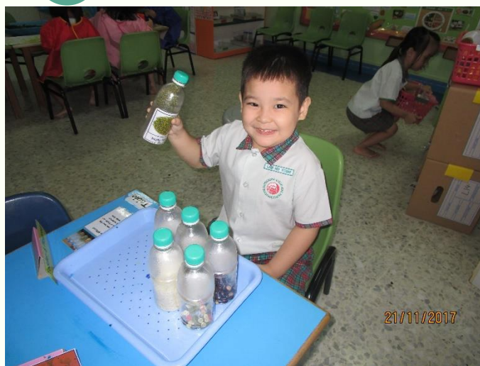
听不同种子的声音